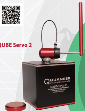
世界で唯一の制御工学を学べる教育教材